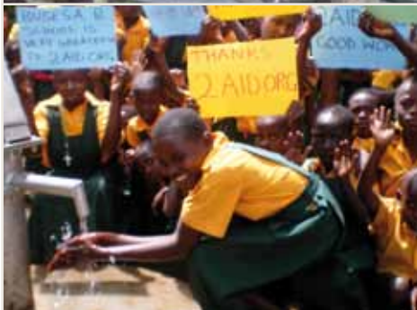
Mein Brunnen ist fertig: 16. November 2010

Ich war schon immer ein Mensch, der sich Ziele setzt, an sie glaubt und sie dann hartnäckig und mit viel Energie verfolgt. Natürlich hat mich das nicht vor Rückschlägen, Irrtümern oder Fehlentscheidungen bewahrt. Aber am Ende hat sich der schwierige und manchmal steinige Weg gelohnt.